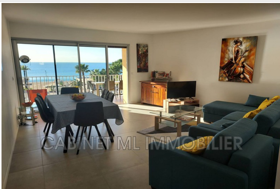
Appartement 1 chambre OLLIER Fréjus